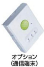
オプション (通信端末)